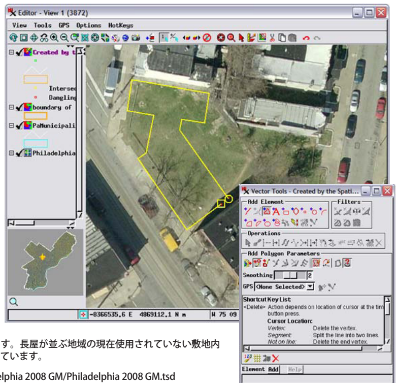
(上図) タイルセットの TNT での表示。タイルセットは TNTmips で作成。ペンシルバニア州フィラデルフィア市の 10 センチメートル(4 インチ) 解像度の正射画像。下の URL で公開しています。オレンジ色のポリゴンは、フィラデルフィア北部の 180 エーカーの再開発地域を表わしています。(右図) インターネット上にある同じタイルセットを TNT 空間エディタの参照レイヤとして使用し、最大解像度近くまで拡大しています。長屋が並ぶ地域の現在使用されていない敷地内に、提案中の新住宅 1 戸の輪郭がベクタのポリゴンとして描かれています。

http://www.microimages.com/geodata/742_0/Philadelphia 2008 GM/Philadelphia 2008 GM.tsd