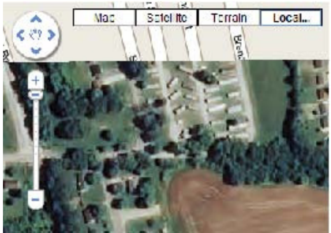
Google マップの同じタイルオーバーレイを最大ズームレベル 17 で表示したもの (この緯度では Google マップの解像度は 1m です)。