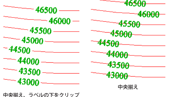
中央揃え、ラベルの下をクリップ