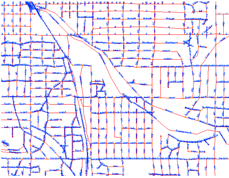
全ての線を選択して、ラベルを自動生成

ラインのラベルの自動生成操作にはいくつかの先進的な機能があります。街路のように連続した線は、ノードや交わる線によって多数の短い線に分割されることが多く、個々の線要素はラベル表示用に同じ属性値を持ちます。ラベルを自動生成する際、左下図のようにこのような線を一本の線として扱うことも可能です。