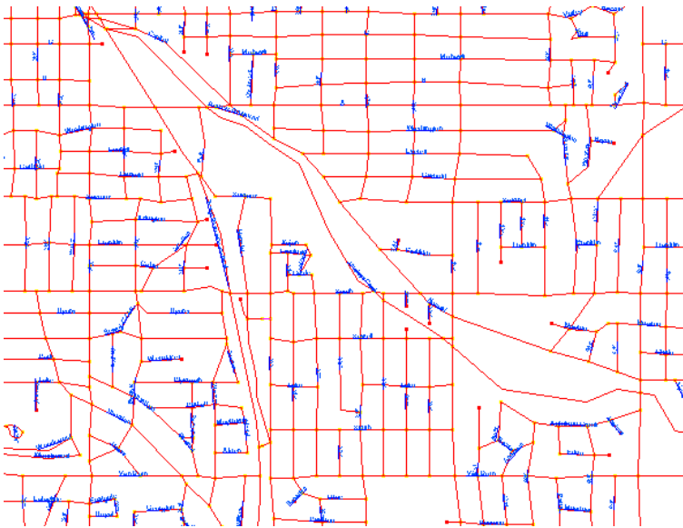
選択した全ての線のラベルをその属性によって自動結合

ラベルは、線の上か下、または中央に配置することが可能です。ラベルの下をクリップして、線がラベル上を通らないようにすることも出来ます。クリップする距離も設定出来ます。ラベルの下の線をクリップする機能 (Clip Under Label) は結果をプレビュー出来ません。ラベルを追加して、ベクタを再描画した時にのみ結果を確認出来ます。ラベルの基準線をラインに合わせる方法として、直線 (Straight)、スプライン (Spline) または正確 (Exact) の中から選択出来ます。