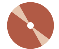
インストール ディスク